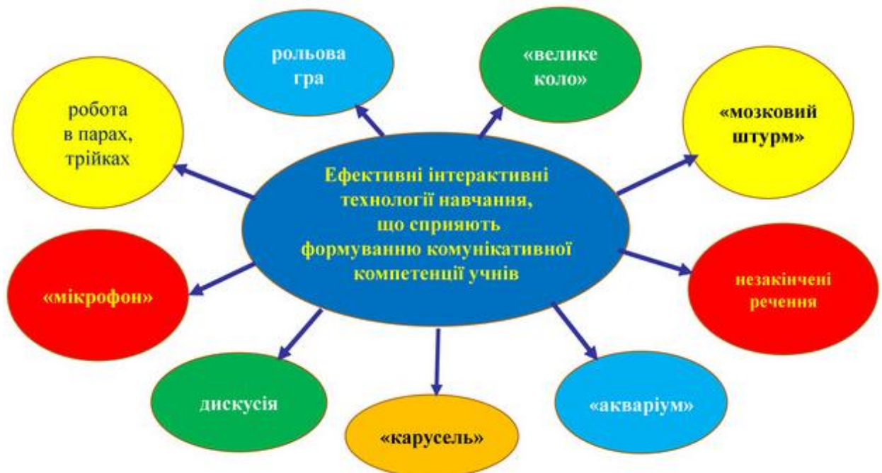
Рис. 2. Види інтерактивних технологій навчання